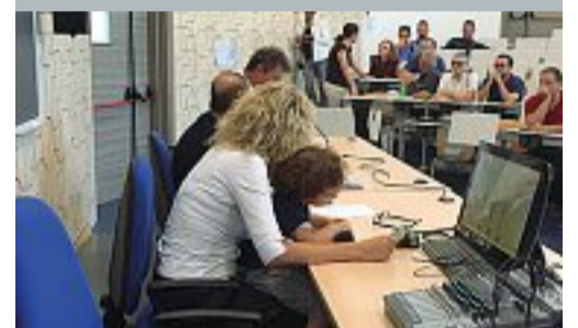
In braccio La ministra Lezzi con il figlio all'Unisalento